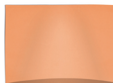
33 x 25 cm