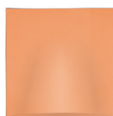
25 x 25 cm