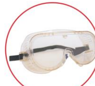
1 paire de lunettes