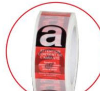
Rouleau adhésif amiante