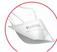
Masque de protection FFP3 Kolmi Oxygen EN 149:2001+A1:2009