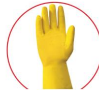
1 paire de gants