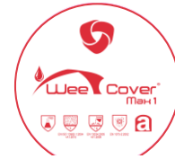
Combinaison à capuche WeeCover Max1 EPI Cat. III – Type 5/6