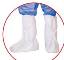
1 paire de surbottes